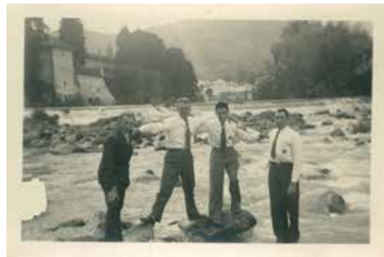
Met droge voeten in de Gave

“Te Lour’ op de bergen verscheen in een grot, vol glans en vol luister, de Moeder van God”. Het liedje brengt me terug naar mijn kinderjaren. Mijn grootmoeder bracht van haar eerste Lourdesbedevaart een muziekdosje in de vorm van een Lourdesgrotje mee. Ze was er heel zuinig op. Heel af en toe, en onder toezicht, mochten de kleinkinderen het dosje opdraaien om het melodietje te laten spelen. In haar tuin, tussen blauwe campanula, stond een Lourdesgrotje. In de gang hing een groot stadszicht op Lourdes. En we hebben allemaal een gouden Lourdesmedaille gekregen van haar. Hoe komt het toch dat het eenvoudige melodietje zo in het collectieve geheugen van de oudere Vlamingen terecht is gekomen? En waarom is een bedevaart naar het verre Frans-Lourdes zo vanzelfsprekend voor Vlaamse katholieken? Want in de vorige eeuw gaat het om een zware reis: bijna 20 uur onderweg, in een oncomfortabele trein, met douane die valiezen en paspoorten controleert, op weg naar een land met een andere taal en een andere munteenheid. Voor vele Vlamingen is het de enige buitenlandse reis in hun leven, velen moeten sparen om de bedevaart te kunnen maken. Dikwijls is het een familiegebeuren en trekken drie generaties samen naar Lourdes.