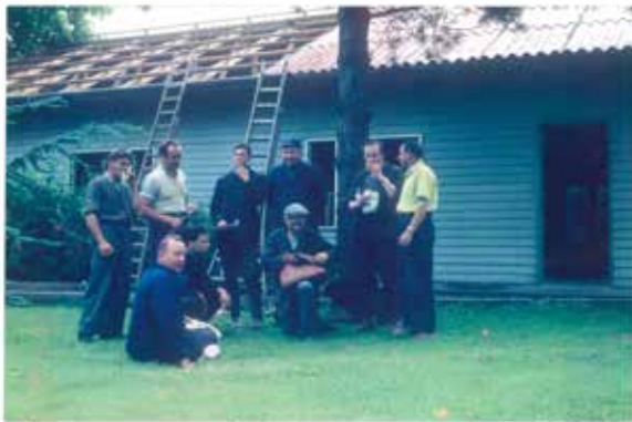
afbreken barak in d.l.v. Presentatie To Lohren Dit gebaau zal ons eerste kerkje worden!

Op enkele dagen tijd wordt de barak heropgebouwd. Dit manoeuvre wordt herhaald met een verhuizing van een kleinere barak die weg moet op Antwerpen-Linkeroever.