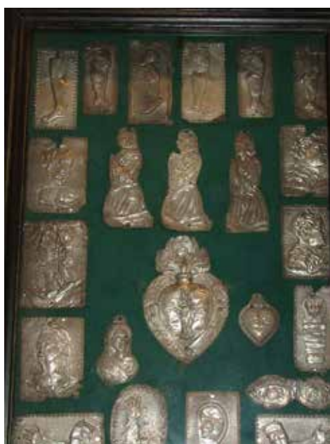
Zilveren ex voto's

Enkele meters verder, bij het Sint-Antoniusaltaar, hangt een kader met zilveren ex voto's, ook met harten, ... Het moet zijn dat er in Puivelde heel wat wondere genezingen zijn gebeurd of dat de gelovigen van Puivelde niet alleen met gewijde kaarsen dankbaar willen zijn of van de Heer gunsten willen bekomen.