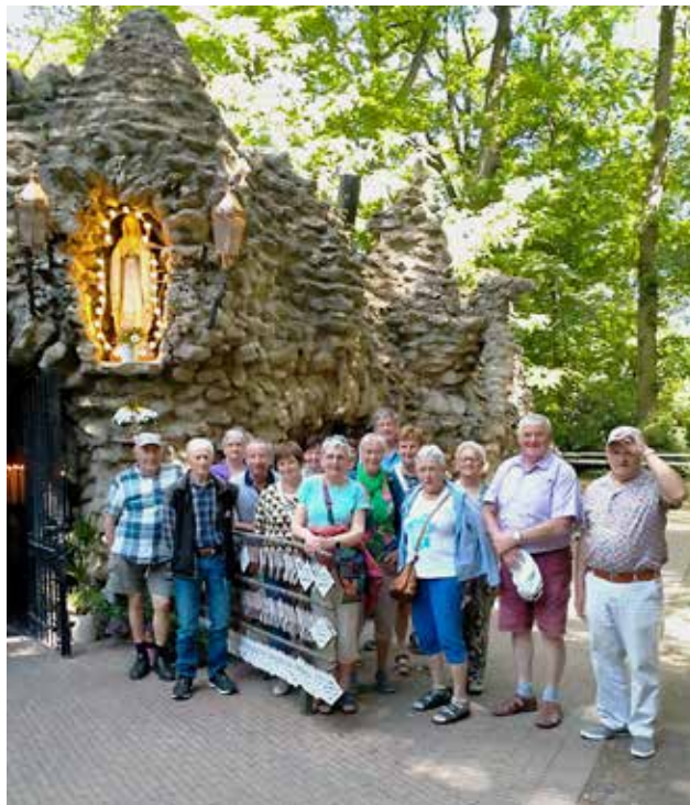
Wie niet naar Frans-Lourdes gaat kan naar Oostakker-Lourdes: Ferm Puivelde, mei 2025