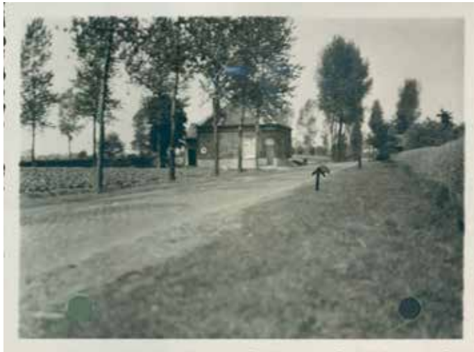
Café de Wuytensnest in de Hoge Bokstraat ter hoogte van de Omloopwegel.

Begin jaren 1960 wordt Manu Verhulst onderpastoor in Belsele. Hij stelt al heel snel vast dat het gebied aan de Valk en de Watermolenwijk in die jaren een soort niemandsland is tussen Sint-Niklaas en Belsele. Nochtans wordt hier een volledig nieuwe woonwijk gebouwd: de Matexiwijk. De Hoge Bokstraat is dan nog bijna onberijdbaar: een bolle kasseibaan met links en rechts een gracht. Regelmatig kampt de straat met wateroverlast. Enkele boerderijen en één enkel cafeetje staan er tussen de velden.