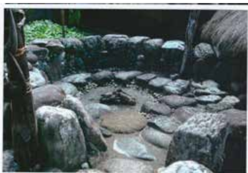
Hut van de Igorotten

allemaal maar komen en gaan. Dan hebben we nog dorpen op 1, 2, 3, 4, 5 uren afstand en tot 1, 2 dagen waar we naartoe moeten. Daar valt er ook te werken op christenen van kindsbeen af, of Igorotten over lang gedoopt. Maar die van toeten of blazen weten, nooit hunnen plichten gekweten hebben, of waarvan het al lang geleden is.