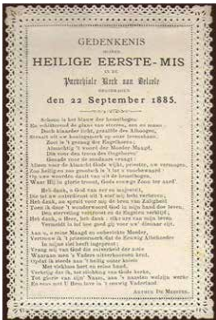
Ook zijn eerste Eucharistieviering draagt hij op in Belsele

van de herberg “Het Houten Been”. Na de heropbouw in 1843 krijgt de zaak de meer stichtende naam “Het Hof Sint-Sebastiaan”. Dit jaartal is nog steeds te zien boven de deur van het huis voor de parochiezaal. Naast herbergier is grootvader Stevens ook slachter, beenhouwer en vleeshandelaar die zijn centjes slim investeert in vastgoed. Hij koopt namelijk vele kleine armtierige huisjes die hij dan verhuurt. Het kan niet anders dat deze kloeke gewiekste beer (de man is geboren in 1799 maar zal maar liefst 92 jaar worden, een hele prestatie in die tijd) een zeer gekend figuur is in het dorpsleven van Belsele in die tijd.