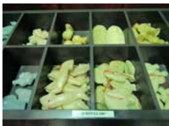
Ex voto's 0,75 euro

Toen ik enkele jaren geleden in de Sint-Jobkerk van Puivelde foto's van het Sint-Antoniusbeeld ging nemen, stuitte ik op een bak met witte en blauwe wassen ex voto's 1 . Kinderhoofden en -lichamen, harten, benen, maar ook varkens, vogels en runderen lagen mooi gescheiden van elkaar te koop tegen 0,75 EUR het stuk. Een koopje.