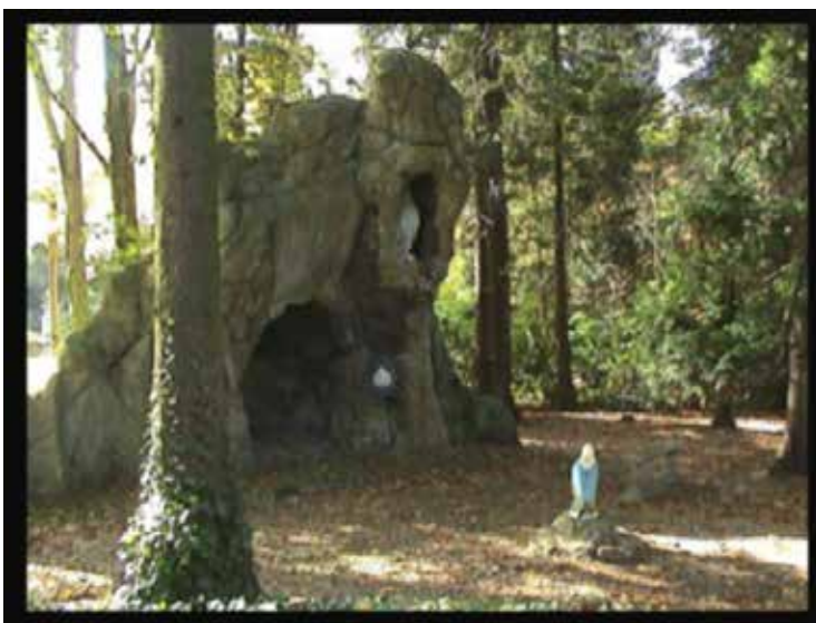
Gecementeerde grot met heiligenbeeld en arduinen gedenksteen: "Memento confratrum defm. 1935", kasteel Belsele

eningen, met een kleine rente. Op de feestvergaderingen worden tombola's georganiseerd waar deelnemende leden een Lourdesreis kunnen winnen. Er worden dia-avonden georganiseerd voor en na de bedevaart. Er is een eucharistieviering, voor en na de bedevaart is er een dankviering. Op de trein die stopt in Belsele, zitten ook bedevaarders uit andere Wase gemeentes. In de trein krijgt elke bedevaarder een kenteken en een bedevaartgids. Groepen van 50 tot 70 Belselenaren zijn de regel tot de jaren 1970 met vertegenwoordigers uit alle generaties. In Lourdes is er een groepsverantwoordelijke, te herkennen aan de speciale armband. Hij/zij zorgt voor zijn/haar mensen zodat ze zich veilig voelen in dat verre Frankrijk. De bedevaart wordt ook gecombineerd met toeristische uitstappen: naar Gavarny, Lac d'Artouste, de Tourmalet. Voor velen is de Lourdesreis een hoogtepunt in hun leven.