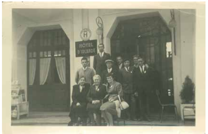
Voor het hotel

Dat de gewone man ook naar Lourdes kan reizen hangt samen met een sociaal-politieke revolutie. In 1936 wordt de wet op betaalde vakantie gestemd waardoor de arbeider voor het eerst zes dagen verlof met behoud van loon krijgt. Na de oorlog volgt het Sociaal Pact met o.a. de ziekteverzekering, kindergeld, 40-uren arbeidsweek én dubbel vakantiegeld. Van bij het begin zijn politici, vakbonden en werkgevers het erover eens dat die zes dagen verlof op een goede en juiste manier ingevuld moeten worden. Er wordt door zowel de katholieke als de socialistische zuil een ganse infrastructuur opgebouwd om die verlofdagen ideologisch in te vullen. Het sociaal toerisme, dus vakantie onder de controle van de grote ideologische zuilen ontstaat. Vakantiehuizen aan zee of in de bergen, georganiseerde uitstappen in binnen- en buitenland, met begeleiding en animatie kennen een bloeiperiode na de Tweede Wereldoorlog.