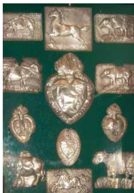
Zilveren ex voto's