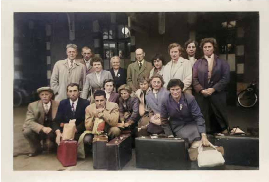
Boeren- en Boerinnenbond voor hun hotel, 1958

“Te Lour’ op de bergen verscheen in een grot, vol glans en vol luister, de Moeder van God”. Het liedje brengt me terug naar mijn kinderjaren. Mijn grootmoeder bracht van haar eerste Lourdesbedevaart een muziekdosje in de vorm van een Lourdesgrotje mee. Ze was er heel zuinig op. Heel af en toe, en onder toezicht, mochten de kleinkinderen het dosje opdraaien om het melodietje te laten spelen. In haar tuin, tussen blauwe campanula, stond een Lourdesgrotje. In de gang hing een groot stadszicht op Lourdes. En we hebben allemaal een gouden Lourdesmedaille gekregen van haar. Hoe komt het toch dat het eenvoudige melodietje zo in het collectieve geheugen van de oudere Vlamingen terecht is gekomen? En waarom is een bedevaart naar het verre Frans-Lourdes zo vanzelfsprekend voor Vlaamse katholieken? Want in de vorige eeuw gaat het om een zware reis: bijna 20 uur onderweg, in een oncomfortabele trein, met douane die valiezen en paspoorten controleert, op weg naar een land met een andere taal en een andere munteenheid. Voor vele Vlamingen is het de enige buitenlandse reis in hun leven, velen moeten sparen om de bedevaart te kunnen maken. Dikwijls is het een familiegebeuren en trekken drie generaties samen naar Lourdes.